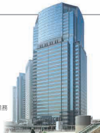
品川イーストワンタワー

商号(社名) : 大東建託株式会社 代 表 者 : 代表取締役社長 小林 克満 本 社 所 在 地 : 東京都港区港南二丁目16番1号 設 立 年 月 日 : 1974年6月20日 資 本 金 : 29,060百万円(東証、名証一部上場) 社 員 数 : 単体8,691名(常用雇用者数)(2020年9月末現在) 主 な 事 業 内 容 : ①アパート、マンション、貸店舗、貸工場、貸倉庫及び貸事務所等の建設業務 ②入居者斡旋等の不動産仲介業務、及び建物管理並びに 賃貸借契約管理等の不動産管理業務